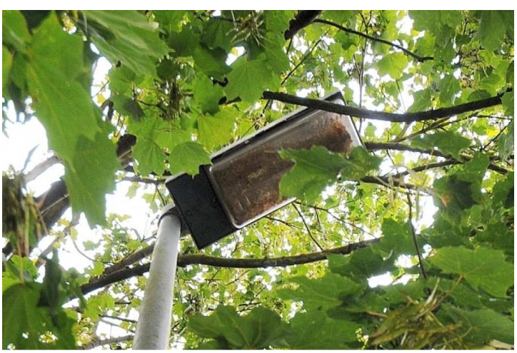
Da leuchtet nichts mehr!

Ich bitte daher die Betroffenen solcher Verdunklungsaktionen, ihre Bäume und Sträucher soweit zuzuschneiden, dass die Straßenbeleuchtung wieder das tut, was sie tun soll, nämlich die Straße beleuchten.